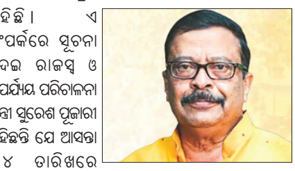
ମୁଖ୍ୟମନ୍ତ୍ରୀ ମୋହନ ଚରଣ ମାଝୀ

ଭୁବନେଶ୍ୱର, ୨୦୧୧ (ଭାସ୍କର ନ୍ୟୁଜ): ବାତ୍ୟା ଦାନା ଏବଂ ପରବର୍ତ୍ତୀ ବନ୍ୟା ଜନିତ କ୍ଷୟକ୍ଷତି ଆକଳନ ପାଇଁ ଆସନ୍ତା ୨୪ ତାରିଖରେ କେନ୍ଦ୍ର ସରକାରଙ୍କ ଏକ ଟିମ୍ ଓଡ଼ିଶା ଗସ୍ତରେ ଆସିବ। ଏହି ଟିମ୍ ୨୭ ତାରିଖ ପର୍ଯ୍ୟନ୍ତ ଓଡ଼ିଶାରେ ରହି ପ୍ରଭାବିତ ୩ ଜିଲ୍ଲା ଗସ୍ତ କରି କ୍ଷୟକ୍ଷତି ଆକଳନ କରିବା ସହ ରାଜ୍ୟ ସରକାରଙ୍କ ଦକ୍ଷ ଅଧିକାରୀଙ୍କ ସହ ଆଲୋଚନା କରିବେ ବୋଲି ସୂଚନା ମିଳିଛି। ସେହିପରି କେନ୍ଦ୍ରୀୟ ଟିମ୍ ଫେରିବା ପୂର୍ବରୁ ମୁଖ୍ୟମନ୍ତ୍ରୀ ମୋହନ ଚରଣ ମାଝୀଙ୍କୁ ଆକ୍ରମଣ ଅଭିଯୋଗ କରାଯାଇଛି। ଶ୍ରୀ ମାଝୀଙ୍କୁ ଆକ୍ରମଣ ଅଭିଯୋଗ କରାଯାଇଛି। ଶ୍ରୀ ମାଝୀଙ୍କୁ ଆକ୍ରମଣ ଅଭିଯୋଗ କରାଯାଇଛି।