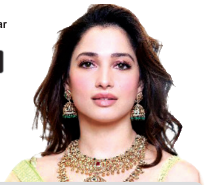
କଟି ମର୍ତ୍ତ୍ୟ 'ଚୋର' ଲେଖାଥିବାରୁ ରାଜିଲେ ତମକୁ

facebook.com/odishabhaskar twitter.com/odishabhaskar GET IT ON Google Play Download on the App Store