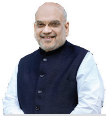
ଶାହକ ଅଧ୍ୟକ୍ଷତାରେ ଉଚ୍ଚଶ୍ରମୀୟ କମିଟି