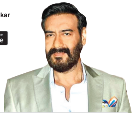
ମେ'ରେ ରିଲିଜି ହେବ ଅକ୍ଷୟ 'ରେଡ-୨'

facebook.com/odishabhaskar twitter.com/odishabhaskar GET IT ON Google Play Download on the App Store