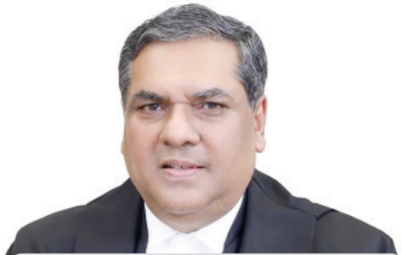
ସିଦ୍ଧି ନିହାଳି ମାମଲା ଶୁଣାଣିରୁ ଓହରିଲେ