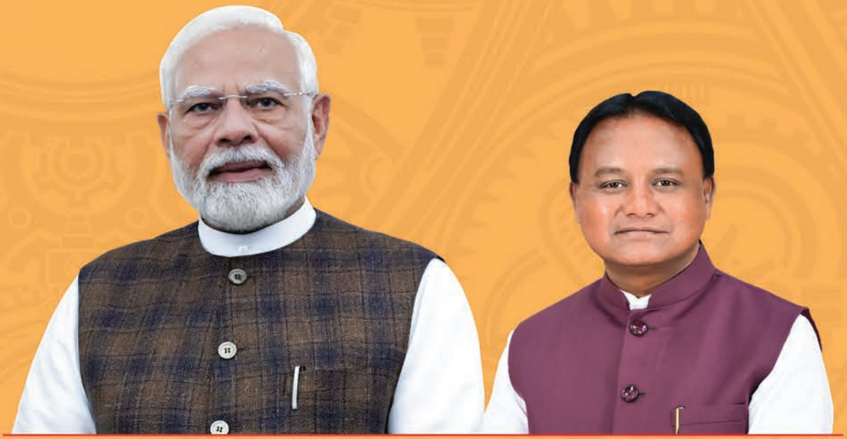
Shri Narendra Modi Prime Minister

Hon'ble Prime Minister, Shri Narendra Modi inaugurates the Utkarsh Odisha – Make in Odisha Conclave 2025 today, we invite industry leaders and entrepreneurs to be a part of this transformational journey.