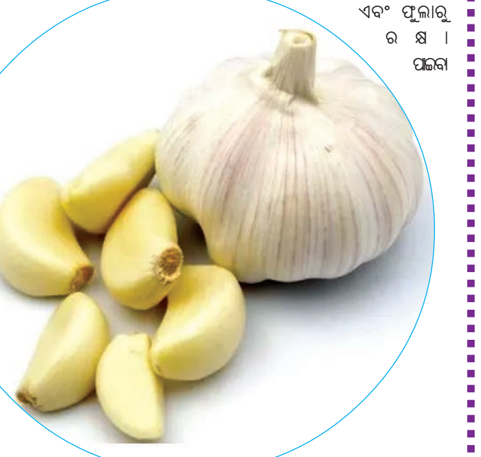
ପାଇଁ ଚାହୁଁଛନ୍ତି ତେବେ ରସୁଣକୁ ନିୟମିତ ଭାବରେ ଖାଆନ୍ତୁ ଏବଂ ତେଲରେ ଫୁଟାଇ ଲଗାନ୍ତୁ । ବହୁତ ଶୀଘ୍ର ଆପଣଙ୍କ ଯନ୍ତ୍ରଣା ଦୂର ହେବ ।

ବାସ୍ତବରେ, ଆପଣ ନିଜ ଖାଦ୍ୟରେ ଯେକୌଣସି ଭାବରେ ରସୁଣକୁ ସାମିଲ କରିପାରିବେ । କିନ୍ତୁ ଏହି ସୁରିକ୍ ଏସିଡ୍ ରୋଗୀ ସକାଳେ ଖାଲି ପେଟରେ କିଛି ରସୁଣକୁ ଖାଇଲେ ଲାଭ ମିଳିଥାଏ । ରସୁଣର ଦୁଇଟି ପାଖୁତାକୁ ନେଇ ଉଷ୍ଣ ପାଣି ସହିତ ଚୋବାଇ ଖାଆନ୍ତୁ । ଯଦି ଆପଣ ଚାହାଁନ୍ତି ତେବେ ତା' ସହିତ ମଧ୍ୟ ରସୁଣକୁ ଖାଇପାରିବେ । ଆପଣଙ୍କୁ କିଛି ଦିନ ପାଇଁ ନିୟମିତ ରସୁଣ ଖାଇବାକୁ ପଡିବ । ଏହା ସହିତ ସୁରିକ୍ ଏସିଡ୍ ପ୍ରଭାବଶାଳୀ ଭାବରେ ନିୟନ୍ତ୍ରଣ ହେବ । ଏହା ବ୍ୟତୀତ, ରସୁଣ ଖାଇବା ଦ୍ୱାରା ବୃତ୍ତ ପ୍ରେସର ନିୟନ୍ତ୍ରଣରେ ରହିବା ସହ କୋଲେଷ୍ଟ୍ରଲ ମଧ୍ୟ କମ୍ ହେବ । ଏହା ସହ ଖାଲି ରସୁଣ ଖାଇବା ଦ୍ୱାରା ଗଣ୍ଠି ଯନ୍ତ୍ରଣା କମ୍ ହୋଇନଥାଏ ବରଂ ସୋରିଷ ତେଲ ସହ ରସୁଣକୁ ଫୁଟାଇ ଗଣ୍ଠିରେ ଲଗାଇ ଦ୍ୱାରା ବିଶ୍ୱା ଏବଂ ଗଣ୍ଠି ଫୁଲା ମଧ୍ୟ କମ୍ ହୋଇଥାଏ । ତେଣୁ ଯଦି ଆପଣ ଗଣ୍ଠି ବିନ୍ଧା ଏବଂ ଫୁଲାରୁ ରକ୍ଷା ପାଇବା