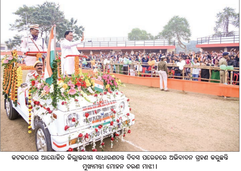
କଟକଠାରେ ଆୟୋଜିତ କିଲ୍ଲାଖରୀୟ ସାଧାରଣତନ୍ତ୍ର ଦିବସ ପରେ ଉଦ୍‌ଘାଟନ କରାଯାଇଥିବା ଉତ୍କର୍ଷ ଓଡ଼ିଶା ମୋହନ ଚରଣ ମାଝୀ ।

ଭୁବନେଶ୍ୱର, ୨୭ (ଭାସ୍କର ନ୍ୟୁଜ): ଉତ୍କର୍ଷ ଓଡ଼ିଶା ବିକଶିତ ଭାରତ ଗଠନ ଦିଗରେ ଉତ୍ପ୍ରେରକ ହେବ ବୋଲି ରାଜ୍ୟପାଳ ଡ. ହରି ବାବୁ କମ୍ବରପାଟି କହିଛନ୍ତି । ଆଜି କନ୍ଫେରେନ୍ସରେ ଅପ୍ ଜଷ୍ଟିଆନ ଇଣ୍ଡିଆ (ସି.ଆଇ.ଆଇ.)ର ଯଜ୍ଞ ଉତ୍ସାହୀ ଉଦ୍‌ଘାଟନ କରାଯାଇଛି । ଏହି ଉଦ୍‌ଘାଟନରେ ପ୍ରଧାନମନ୍ତ୍ରୀ ନରେନ୍ଦ୍ର ମୋଦୀ ଉଦ୍‌ଘାଟନ କରିବା ସମୟରେ କିଛି ଶୁଭାଚ୍ଛା ପ୍ରକାଶ କରିଥିଲେ । ଏହି ଉଦ୍‌ଘାଟନରେ ପ୍ରଧାନମନ୍ତ୍ରୀ ନରେନ୍ଦ୍ର ମୋଦୀ ୨୮ ତାରିଖ ପୂର୍ବାହ୍ନରେ ଭୁବନେଶ୍ୱର ଉପରେ ପହଞ୍ଚିବେ । ଏହାପରେ ବିଭିନ୍ନ ଉଦ୍‌ଘାଟନ କାର୍ଯ୍ୟକ୍ରମ ରହିବ । ଏହି ଅବସରରେ କେନ୍ଦ୍ରମନ୍ତ୍ରୀ ଧର୍ମେନ୍ଦ୍ର ପ୍ରଧାନ, କୁସଲ ଓରାମ,