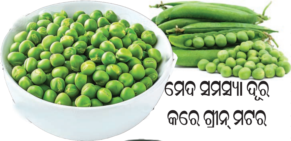
ମେଢ ସମସ୍ୟା ଦୂର କରେ ଗ୍ରୀନ୍ ମଟର

ହଜମ ପ୍ରକ୍ରିୟା ଭଲ ହୁଏ । କଳା ଲୁଣ ଏବଂ ହେଙ୍ଗୁକୁ ଉଷ୍ଣପାଣିରେ ପକାଇ ପିଇଲେ ସଙ୍ଗେସଙ୍ଗେ ବାନ୍ତି ବନ୍ଦ ହୋଇଯାଇଥାଏ । ଏହି କଳା ଲୁଣ ଓ ହେଙ୍ଗୁ ମେଟାବୋଲିଜିମ୍ ବୃଦ୍ଧି କରି ଓଜନ ନିୟନ୍ତ୍ରଣରେ ସାହାଯ୍ୟ କରେ । ଓଜନ କମ୍ କରିବା ପାଇଁ ଚାହୁଁଛନ୍ତି ତେବେ କଳା ଲୁଣ ଏବଂ ହେଙ୍ଗୁର ପାଣି ପିଇବା ଅତ୍ୟନ୍ତ କରୁ । ସେହିପରି ଏହି ଉଭୟ ସାମଗ୍ରୀ ଆର୍ଥିକଅସୁବିଧା ଏବଂ ଆର୍ଥିକ-ଜନସ୍ତ୍ରମେତୋରା ଭରପୂର ଅଟେ । ଏହା ଏସିଡିଟି ସମସ୍ୟା ଦୂର କରିଥାଏ ।