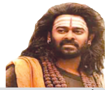
'କନ୍ଦାପା'ରେ ପ୍ରଭାସଙ୍କ ରୁଦ୍ର ଅବତାର

facebook.com/odishabhaskar twitter.com/odishabhaskar GET IT ON Google Play Download on the App Store