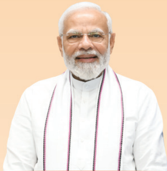
ଶ୍ରୀ ନରେନ୍ଦ୍ର ମୋଦୀ ପ୍ରଧାନମନ୍ତ୍ରୀ