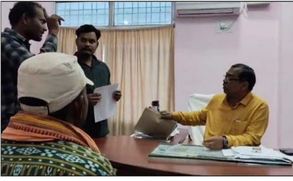
ଧ୍ୟାନ ବିକ୍ରୟ ନେଇ ପ୍ରଶାସନର ଦ୍ୱାରସ୍ଥ ହେଲେ ଚାଷୀ ।

ମାଲକାନଗିରି (ଭାଷର ନ୍ୟୁଜ୍) : ଗତ ତିନିମାସ ଧରି ଧ୍ୟାନ ବିକ୍ରୟ ନେଇ ପ୍ରଶାସନର ଦ୍ୱାରସ୍ଥ ହେଲେ ଚାଷୀ ।