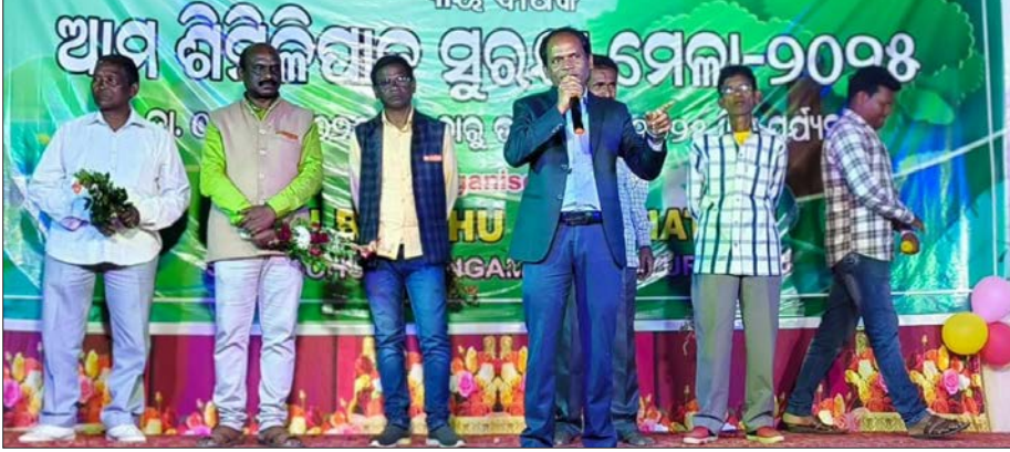
ଶିମିଳିପାଳ ମେଳା ଉଦ୍‌ଘାଟିତ: ଜୈବମଣ୍ଡଳର ସୁରକ୍ଷା ପାଇଁ ସଚେତନତା