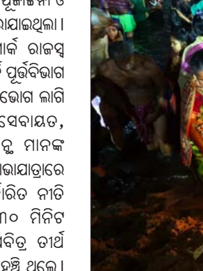
ଚନ୍ଦ୍ରଭାଗା ତୀର୍ଥ ପୁଷ୍କରିଣୀରେ ବୁଡ଼ ପକାଇଲେ ୨ ଲକ୍ଷରୁ ଉର୍ଦ୍ଧ୍ୱ ଶ୍ରବ୍ଦୀକୁ

ପୁରୀ/କୋଣାର୍କ (ଭାଷର ନ୍ୟୁଜ୍) : ଚନ୍ଦ୍ରଭାଗା ତୀର୍ଥ ପୁଷ୍କରିଣୀରେ ପବିତ୍ର ମାଘସପ୍ତମୀ ଅବସରରେ ୨ ଲକ୍ଷରୁ ଉର୍ଦ୍ଧ୍ୱ ଶ୍ରବ୍ଦୀକୁ ବୁଡ଼ ପକାଇଥିବା ବେଳେ ଜିଲ୍ଲା ପ୍ରଶାସନ ପକ୍ଷରୁ ଉଦ୍ଧାରଣ କାର୍ଯ୍ୟ ଚାଲିଛି ।