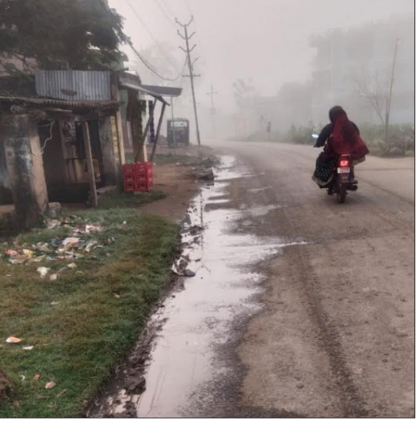
ମଧ୍ୟରେ ଅଧିକାଂଶ ବ୍ୟକ୍ତିଙ୍କୁ ପାନୀୟ ଜଳର ଅଭାବ ହେଉଛି ।

ଗୋପ (ଭାଷର ନ୍ୟୁଜ୍) : ଲୋକେ ପାଣିର ଅଭାବ ହେଲେ ରାଷ୍ଟ୍ରରେ ଲକ୍ଷକୋଟି ଲୋକଙ୍କ ପାନୀୟ ଜଳ ନାହିଁ । ଦିନେ ଦୁଇ ଘଣ୍ଟା ପର୍ଯ୍ୟନ୍ତ ପାନୀୟ ଜଳ ନାହିଁ ।