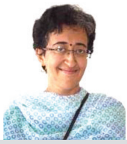
ଆଡ଼ିଶାଙ୍କ ନାମରେ ମାମଲା