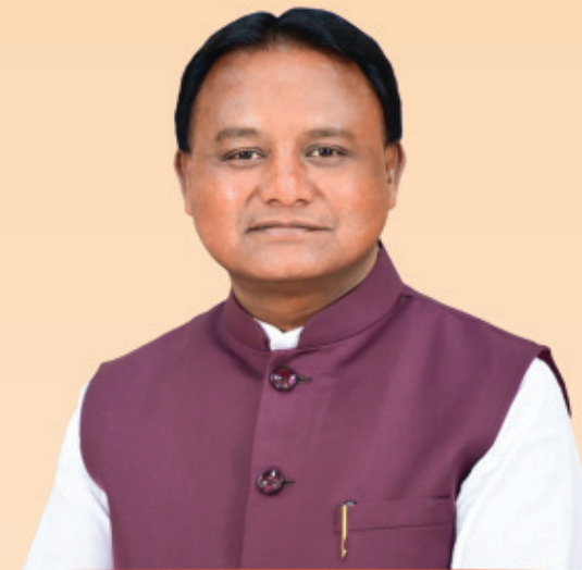
ଶ୍ରୀ ମୋହନ ଚରଣ ମାଝୀ ମୁଖ୍ୟମନ୍ତ୍ରୀ, ଓଡ଼ିଶା