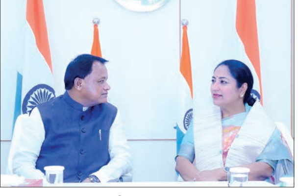
ଲୋକସେବା ଭବନରେ ଦିଲ୍ଲୀ ମୁଖ୍ୟମନ୍ତ୍ରୀ ରେଣୁ ମୁଖ୍ୟମନ୍ତ୍ରୀ ମୋହନ ଚରଣ ମାଝୀଙ୍କ ସହିତ ସୌଜନ୍ୟମୂଳକ ସାକ୍ଷାତ କରୁଛନ୍ତି।

ଆମେରିକାର ଭୂତତ୍ୱ ସର୍ବେ ପକ୍ଷରୁ ସୂଚନା ଦିଆଯାଇଛି। ସେହିପରି ଆହତଙ୍କ ସଂଖ୍ୟା ୨୩୦୦ ଅଛି ବୋଲି ନିଆଁମାର ସରକାରଙ୍କ ପକ୍ଷରୁ ସୂଚନା ଦିଆଯାଇଛି। ନିଆଁମାରର ଏହି ବିପର୍ଯ୍ୟୟ ସମୟରେ ବିଭିନ୍ନ ରାଷ୍ଟ୍ର ସହାୟତା ଯୋଗାଇ ଦେବାକୁ ଆଗଭର ହୋଇଛନ୍ତି। ପ୍ରଧାନମନ୍ତ୍ରୀ ନରେନ୍ଦ୍ର ମୋଦୀ ସବୁପ୍ରକାର ସହାୟତା ଯୋଗାଇ ଦିଆଯିବ ବୋଲି ଘୋଷଣା କରିବା ପରେ ସହାୟତା ପ୍ରଦାନ ଆରମ୍ଭ ହୋଇଛି। ଏକ ୮୦ଜଣିଆ ଏନଡିଆରଏଫ ଟିମ୍ ଉଦ୍ଧାର କାର୍ଯ୍ୟରେ ସାମିଲ ହେବାପାଇଁ ନିଆଁମାର