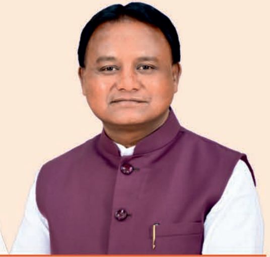
ଶ୍ରୀ ମୋହନ ଚରଣ ମାଝୀ ମୁଖ୍ୟମନ୍ତ୍ରୀ, ଓଡ଼ିଶା