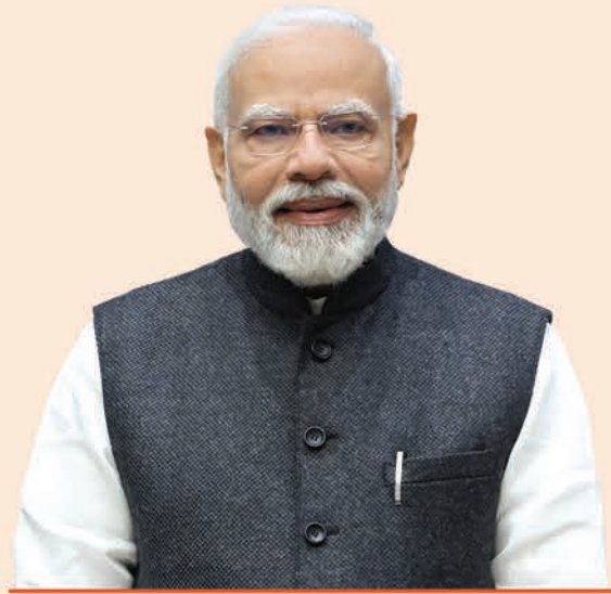
ଶ୍ରୀ ନରେନ୍ଦ୍ର ମୋଦୀ ପ୍ରଧାନମନ୍ତ୍ରୀ