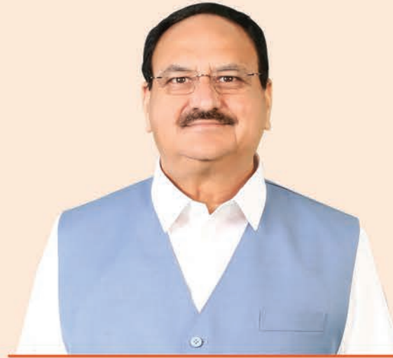
ଶ୍ରୀ ଜଗତ ପ୍ରକାଶ ନଡ୍ଡା କେନ୍ଦ୍ର ସ୍ଵାସ୍ଥ୍ୟ ଓ ପରିବାର କଲ୍ୟାଣ, ସାର ଓ ରସାୟନ ମନ୍ତ୍ରୀ