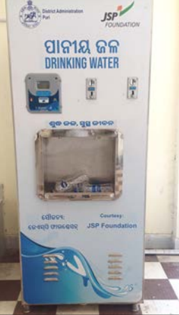
ବିଭିନ୍ନ ପ୍ରକାଶ ନିକଟରେ ଥିବା ପାନୀୟ ଜଳ ମେସିନ ଯଦି ୬ ମାସ ହେଲା ସଚଳ ହୋଇ ପାରୁନି ତେବେ ଗ୍ରାମାଞ୍ଚଳରେ ଖରାପ ହେଉଥିବା ପାନୀୟ ଜଳ ପ୍ରକଟ କେମିତି

ଗୋପ, (ଭାସ୍କର ନ୍ୟୁଜ୍) : ଗୋପ ବ୍ଲକ ବିଭିନ୍ନ କାର୍ଯ୍ୟାଳୟ ନିକଟରେ ଥିବା ପାନୀୟ ଜଳ ମେସିନ ୬ ମାସ ହେଲା ଅଚଳ। ଏବେ ପ୍ରତ୍ୟକ୍ଷ ଗ୍ରାହୀ ପ୍ରାୟ ଯେଉଁ ଲୋକମାନେ ପାନୀୟ ଜଳ ପାଇଁ ହା ହା କାର ହେଉଥିବା ବେଳେ ବ୍ଲକ କର୍ମଚାରୀଙ୍କ ସମେତ ବିଭିନ୍ନ କାର୍ଯ୍ୟ ପାଇଁ ବ୍ଲକକୁ ଆସୁଥିବା ଜନ ସାଧାରଣ ପାନୀୟ ଜଳ ପାଇଁ ତହଲ ବିକଳ ହେଉଛନ୍ତି। ହେଲେ ଏଯାବତ୍ ବ୍ଲକ ପକ୍ଷରୁ କୌଣସି ଠାରେ ଏପରିକି କାର୍ଯ୍ୟାଳୟ ପକ୍ଷରୁ ଜଳଛତ୍ର ଖୋଲିନଥିବା ବେଳେ ୬ ମାସରୁ ଉର୍ଦ୍ଧ୍ୱ ହେଲା ବିଭିନ୍ନ କାର୍ଯ୍ୟାଳୟ ପ୍ରକାଶ ସାମ୍ବାରେ ଥିବା ଏହି ମେସିନ ଅଚଳ ହୋଇପଡିଥିବା ଏବଂ ଏଥିପ୍ରତି ଅଧିକାରୀ ଦୃଷ୍ଟି ଦେଉନଥିବା ପରିତାପର ବିଷୟ ହୋଇଛି। ଅନ୍ୟପକ୍ଷରେ ବ୍ଲକ କାର୍ଯ୍ୟାଳୟ